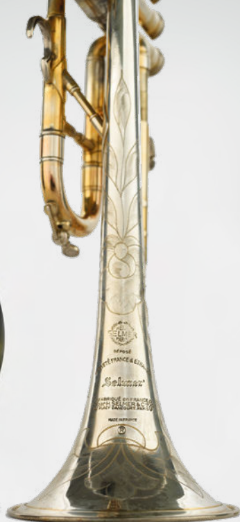
Trompette à pistons Selmer E. 976.14.3