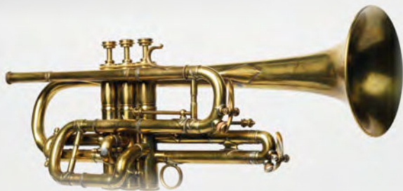
Trompette à pistons E. 0836